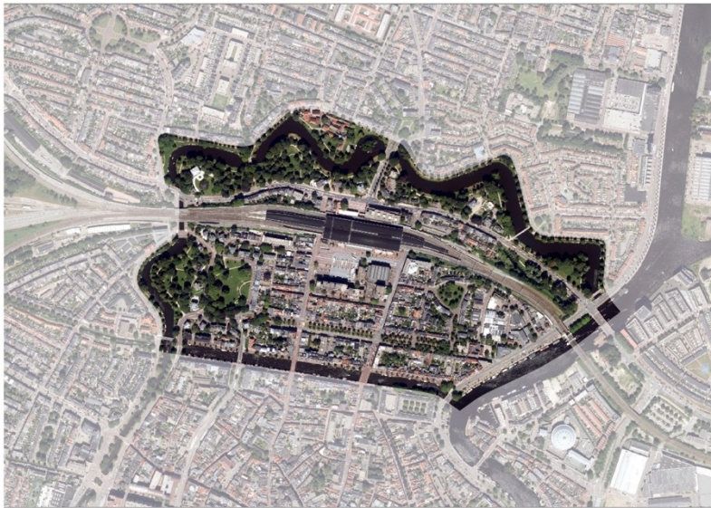
Figuur 3 Afbakening stationsgebied Haarlem