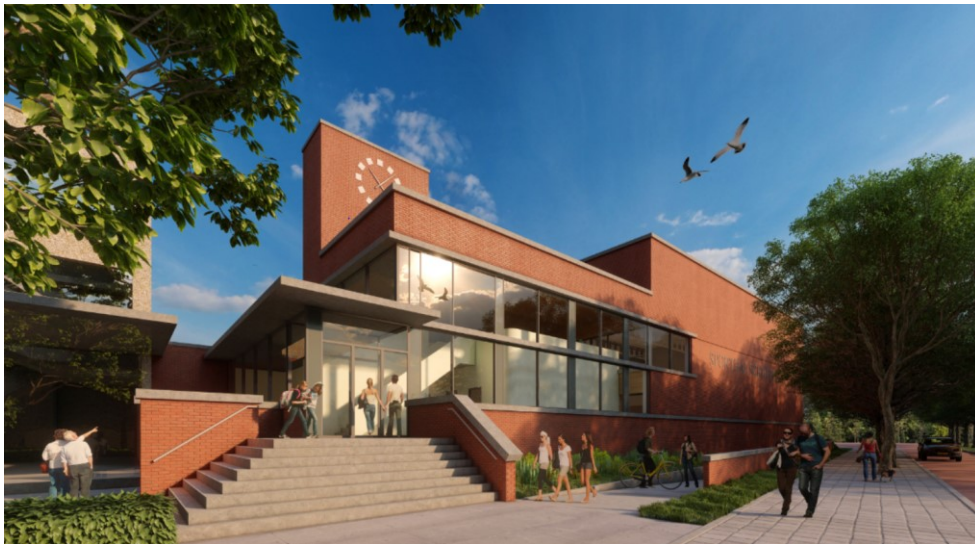
3d impressie AGS architecten

Sinds de gunning in maart is er veel werk verricht: het voorlopig ontwerp en het definitief ontwerp zijn afgerond en getoetst door de gebruikers en de gemeente.