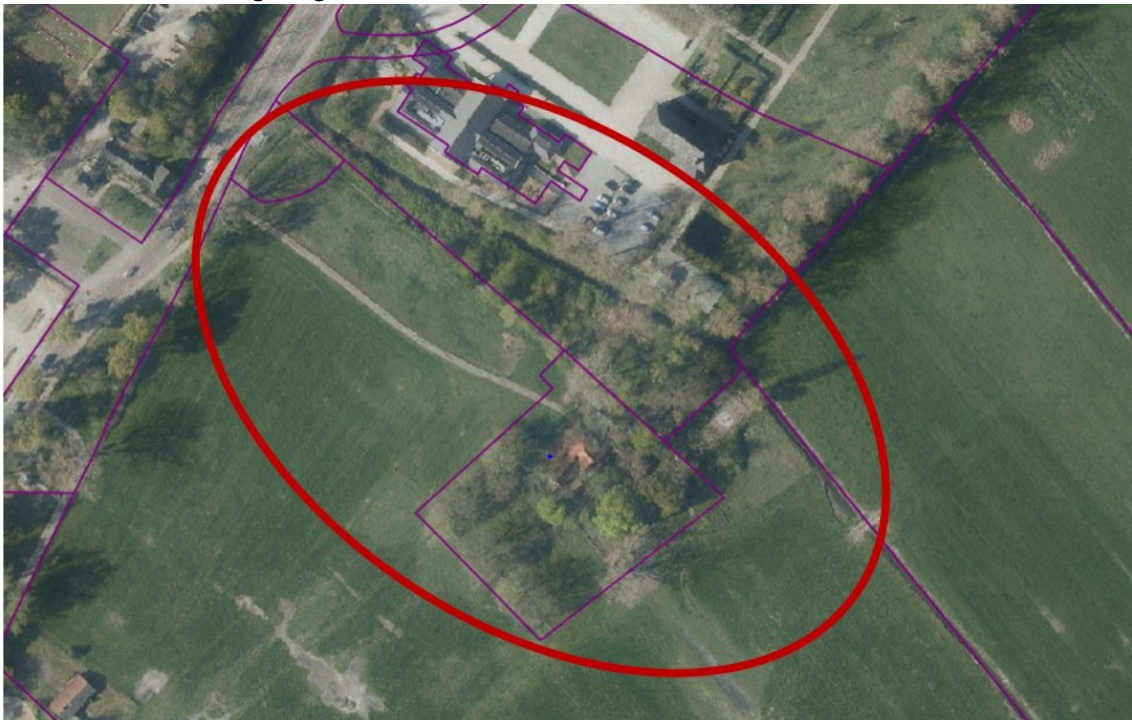
Afbeelding 1: De projectlocatie aan de Vergierdeweg 452/454

De bekendmaking van de locatie aan de Vergierdeweg voor het realiseren van de Skaeve Huse heeft een grote impact gehad op de omwonenden, ondernemers en andere betrokkenen uit het gebied. Haarlemmers willen voorkomen dat de wijk kwetsbaarder wordt door het vestigen van woonvoorzieningen voor mensen met afwijkend woon- en leefgedrag. Bovendien wil men dat de monumentale boerderij hersteld wordt en dat de rust in het natuurgebied en op de nabijgelegen begraafplaatsen niet verstoord wordt. In het project is daarom bijzondere aandacht voor niet alleen de fysieke maar ook de sociale inpassing van de woonvoorziening in de omgeving, inclusief een veiligheids- en beheerplan. Het bijgevoegde participatie- en inspraakplan maakt duidelijk hoe de gemeente met omwonenden en andere belanghebbenden wil komen tot inpassing van de Skaeve Huse in de omgeving.