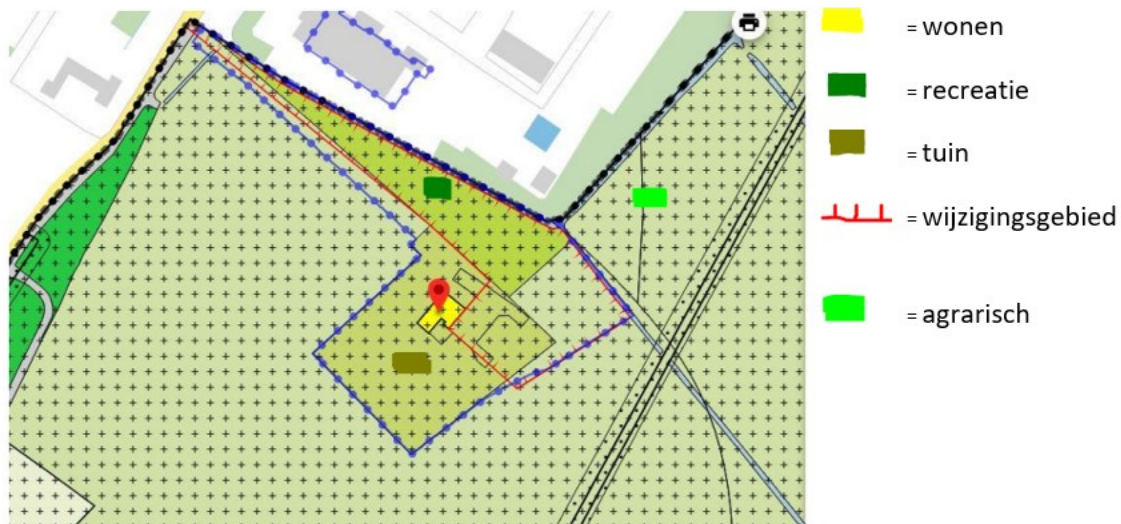
Afbeelding 2: uitsnede uit de bestemmingsplankaart Hekslootgebied/Spaarndam