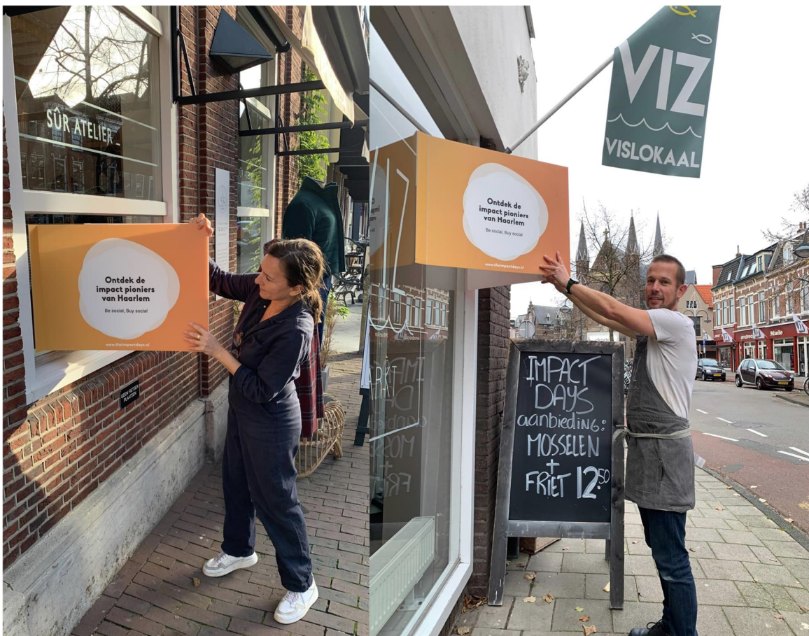
Deelnemers van de Impact Route tijdens de Impact Days 2021.

Vanwege de Lockdown zijn alle events uitgesteld naar het voorjaar van 2022. Er was onvoldoende draagvlak voor een online evenement. Daarom is er gefocust op de route met een communicatie campagne. De Impact Route in Haarlem groeide van 23 naar 50 deelnemers!