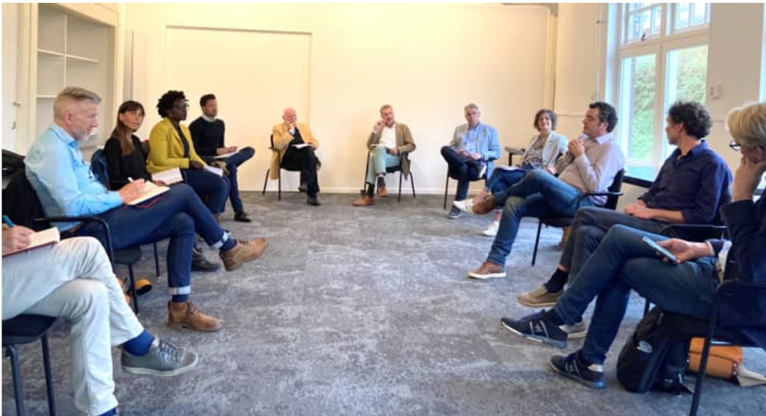
Ronde 'tafel' met impact ondernemers, financiers en investeerders.

Resultaat 2021: in vier Ronde Tafels sessies hebben zeven impact ondernemers en negen financiers input geleverd. Met de deelnemende partijen (impact ondernemers, banken, private investeerders en fondsen) wordt nu aan een platform gebouwd waar impact ondernemers worden begeleid in het opstellen van hun financieringsvraag. Deze wordt door gezamenlijke financiers en fondsen beoordeeld. In het eerste kwartaal van 2022 wordt gezocht naar financiering om dit platform als een pilot te kunnen starten.