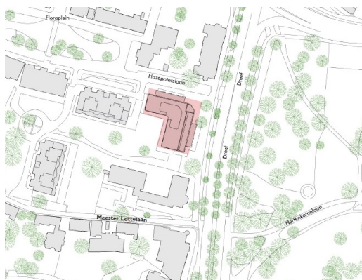
Afbeelding 1: situatie, plattegrond

Met de nieuwe compositie in combinatie met kwaliteit van afwerkingen, ontstaat zo een nieuwe identiteit voor het gebouw: een hoogwaardige architectuur die past bij de hoogwaardige buurt. Huidige eigenaar Rejoko Beheer is initiatiefnemer van de transformatie. Ook na de transformatie blijft het gebouw in eigendom. Beheer vindt plaats vanuit Rejoko beheer organisatie.