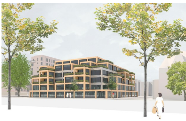
Afbeelding 2: zicht vanaf de Dreef op de transformatie