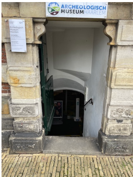
Entree Archeologisch Museum Haarlem

Het archeologisch Museum Haarlem heeft een publieke taak en wil archeologisch erfgoed, en dat van Haarlem in het bijzonder, beleefbaar maken voor een breed publiek door informatie, inspiratie, educatie en waar mogelijk participatie. Het museum is gratis toegankelijk. Het museum wil met de verhalen van het archeologisch erfgoed de collectieve en individuele horizon van de bezoeker verbreden. Het wil de bezoeker laten zien dat er andere, verschillende zienswijzen op het verleden bestaan, en daarmee ook op het heden, die betekenisvol kunnen zijn. Het museum wil de bezoeker de geschiedenis onder meer laten beleven door deze te laten ervaren en interpreteren, door het persoonlijker te maken. Om de publiek ambities te realiseren zoekt en onderhoudt het museum samenwerking op verschillende terreinen, zowel lokaal als regionaal en landelijk.