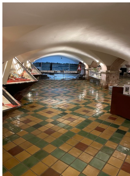
Archeologisch Museum Haarlem