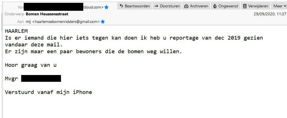
Figuur 1 mail van bewoner