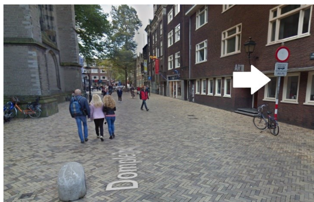
Lijn 2 (Ringlijn Museumkwartier) rijdt vlak langs de Utrechtse Dom